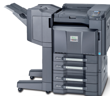
Produkt na zdjęciu zawiera dodatkowe wyposażenie.